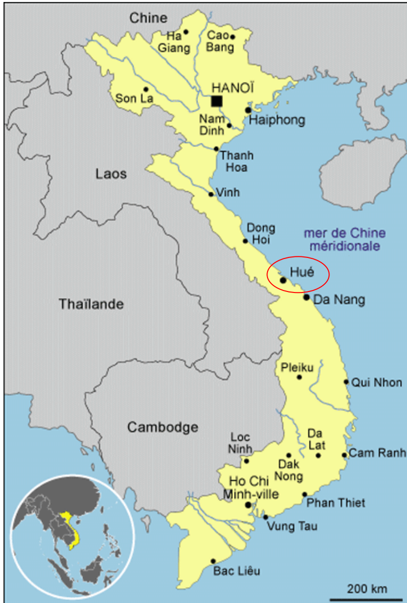
Figure 4 : Carte du Vietnam