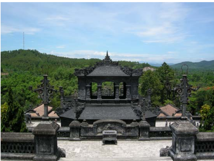
Figure 9 : Tombeau de Khai Dinh