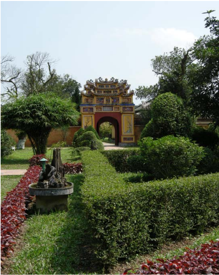
Figure 8 : Cité Impériale