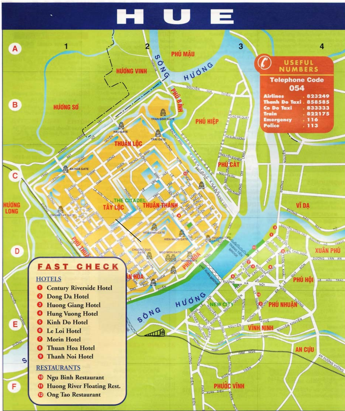
Figure 5 : Carte de Hue