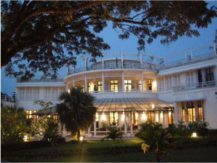
Figure 7 : La Résidence Hôtel & Spa par Accor